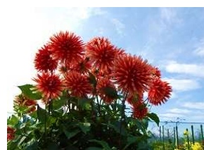
ひばり野ダリア園 開園時期：7月末~10/31 五戸町扇田字長下タ2-75 ※入園料400円(中学生以下無料)