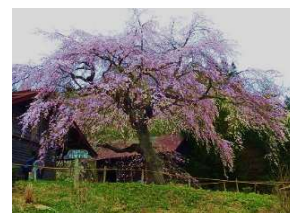
うつき沢のしだれ桜 見頃：4月中旬~下旬 五戸町倉石石沢字槍沢(蒼前神社境内) ※観覧無料