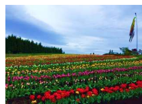
正子のチューリップ園 見頃：4月下旬~5月上旬 五戸町字石仏前 ※入園料400円小学生100円