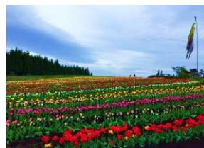
正子のチューリップ園 見頃：4月下旬～5月中旬 五戸町字石仏前 ※入園料 200円