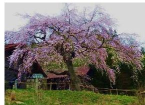
うつぎ沢のしだれ桜 見頃：4月下旬～5月上旬 五戸町倉石沢字檜沢(蒼前神社境内) ※観覧無料